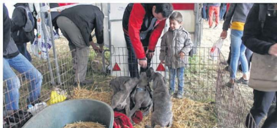
Cap vers le Sud Ouest cette année pour la foire Saint-Denis. Rendez-vous les 9 et 10 octobre à Montilly-sur-Noireau.

de la reporter sur le bon collecteur ci dessous. Au total, vous aurez trois vignettes à collectionner. Une fois, le collecteur dûment complété, renvoyez-le à L'Orne Combattante , 24 Jules-Gévelot 61100 Flers avant le samedi 9 octobre 12 h ou déposez-le sur le stand d'animation. Un tirage au sort sera effectué le dimanche vers 17 h et désignera les grands gagnants. Et la dotation est d'importance grâce aux fidèles partenaires Leclerc Jardi, Le Crédit Mutuel, NRJ, Flers Agglo et cette année, la Biscuiterie de l'Abbaye. L'agence de voyage Flérienne Santana offre un chèque cadeau de 400€, il y a également un séjour en gîte chez François Janoueix à gagner, une croisière avec repas sur le lac de Rabodanges ou encore une demi-journée bien-être pour deux personnes à Bagnoles de l'Orne offert par notre partenaire Bo'Resort, des paniers gourmands et la liste des cadeaux est encore longue. Cette année, toutes les heures, une tombola offrira au public de nombreux