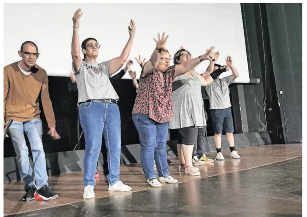
Venez découvrir le spectacle du Foyer des Basses Landes, vendredi 24 septembre.