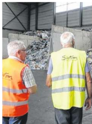
Les visiteurs sont amenés à découvrir le fonctionnement de la structure de l'écopôle.

Durant l'après-midi, plusieurs choses sont prévues : la visite des équipements de collecte de gestion des déchets du Sirtom – quai de transfert des matériaux recyclables et ordures ménagères ; il sera possible de découvrir un stand d'information sur les consignes de tri, le compostage ; il y aura une démonstration d'une benne biocompartimentée et des jeux